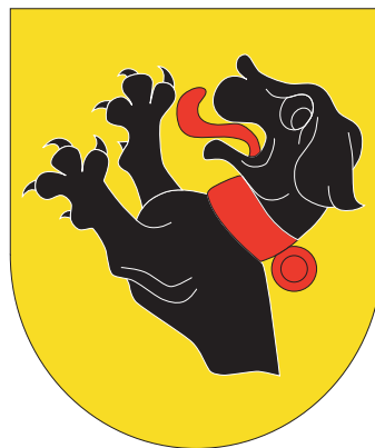
Wappen der Hunziker von Moosleerau