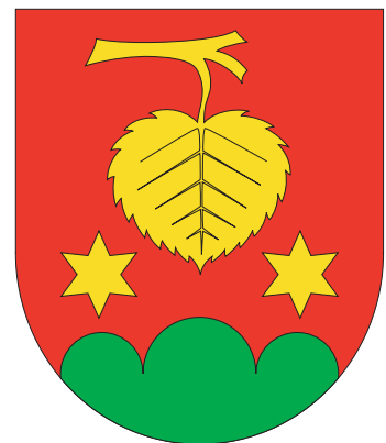
Wappen der Haller von Gontenschwil