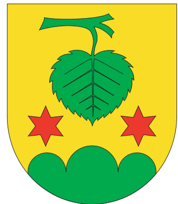
Wappen der Haller aus den Eichen