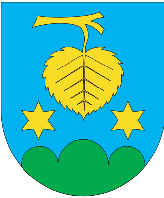
Wappen der Haller von Zetzwil