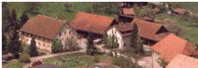
Lenzmühle und ihre Gebäude

In der letzten Jahresschrift unserer Vereinigung wurden die Anfänge der Familien Häfeli von Gontenschwil ausführlich beschrieben. Wir wollen an dieser Stelle ihre weitere Ausbreitung, insbesondere die des «Lenzmüller Stammes» näher beleuchten.